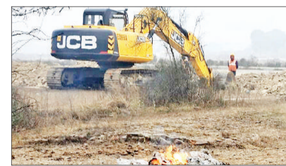
गन्नीर। अंतराष्ट्रीय बागवानी मंडी में टेहा गांव के शमशान घाट के पास खुदाई करती पोपलेन व साथ में जलती चिता।