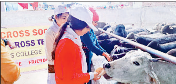
सोनीपत। गोशाला में गायों को रोटियां खिलाती छात्राएं।