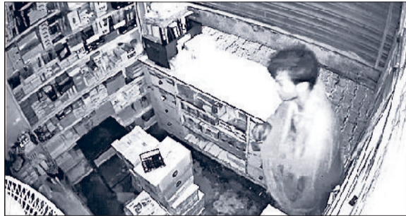
सोनीपत। मिशन रोड स्थित दुकान में लगे सीसीटीवी में दिखाई देता संदिग्ध।