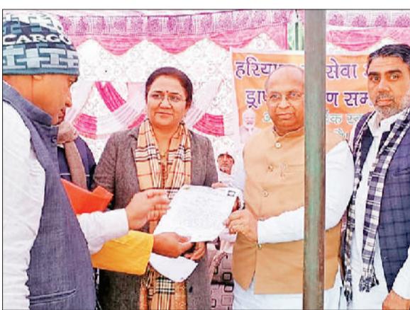
वार्षिक महोत्सव में विधायक को मांग पत्र सौंपते गोशाला समिति के पदाधिकारी।

विधायक निर्मल चौधरी ने गांव सांदल कलां स्थित श्री राधा कृष्ण गोपाल आदर्श गोशाला के वार्षिक महोत्सव कार्यक्रम में बतौर मुख्यतिथि शिरकत की। उन्होंने हरियाणा सरकार द्वारा गन्नीर की 8 गोशालाओं को 80 लाख 39 हजार 250 रुपये की अनुदान राशि जारी करने पर मुख्यमंत्री मनोहर लाल तथा हरियाणा गोसेवा आयोग के अध्यक्ष का आभार जताया। कार्यक्रम के दौरान विधायक व हरियाणा राज्य गोसेवा आयोग के